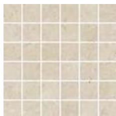
30x30 - 11,8"x11,8" 600068 THALA satin 13 ▲