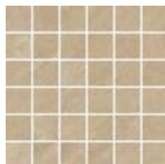
30x30 - 11,8"x11,8" G204190 SAND satin 13 ▲