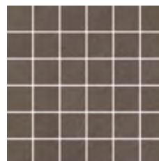
30x30 - 11,8"x11,8" G204200 GRAY satin 13 ▲