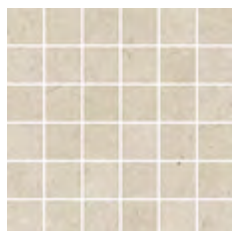
30x30 - 11,8"x11,8" 600068 THALA satin 13 ▲