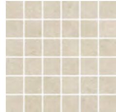
30x30 - 11,8"x11,8" 6000984 GREIGE satin 14 ▲ 6000962 GREIGE str 12 ▲