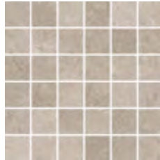
30x30 - 11,8"x11,8" 6000983 GRIGIO satin 14 ▲ 6000961 GRIGIO str 12 ▲