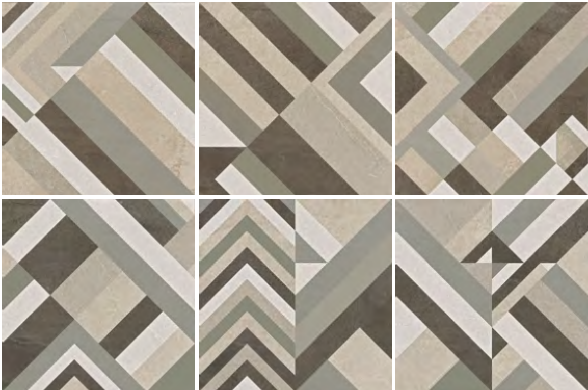
60x60 - 23,6"x23,6" 6000979 satin 47 ■

sviluppo grafico - graphic development 60x60 / 23,6"x23,6" pcs. 6