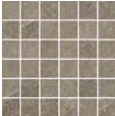
30x30 - 11,8"x11,8" 6000985 ANTRACITE satin 14 ▲ 6000963 ANTRACITE str 12 ▲